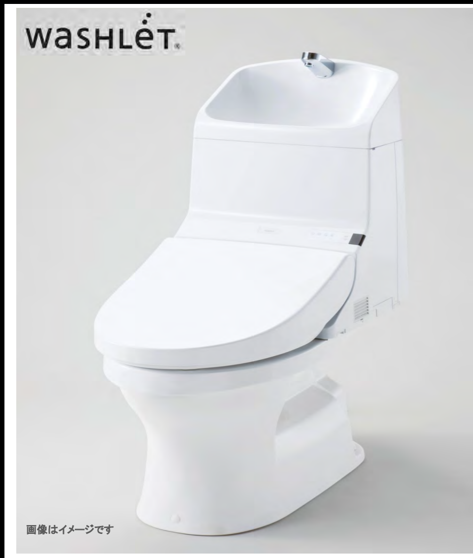
画像はイメージです