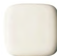
#SC1 パステルアイボリー